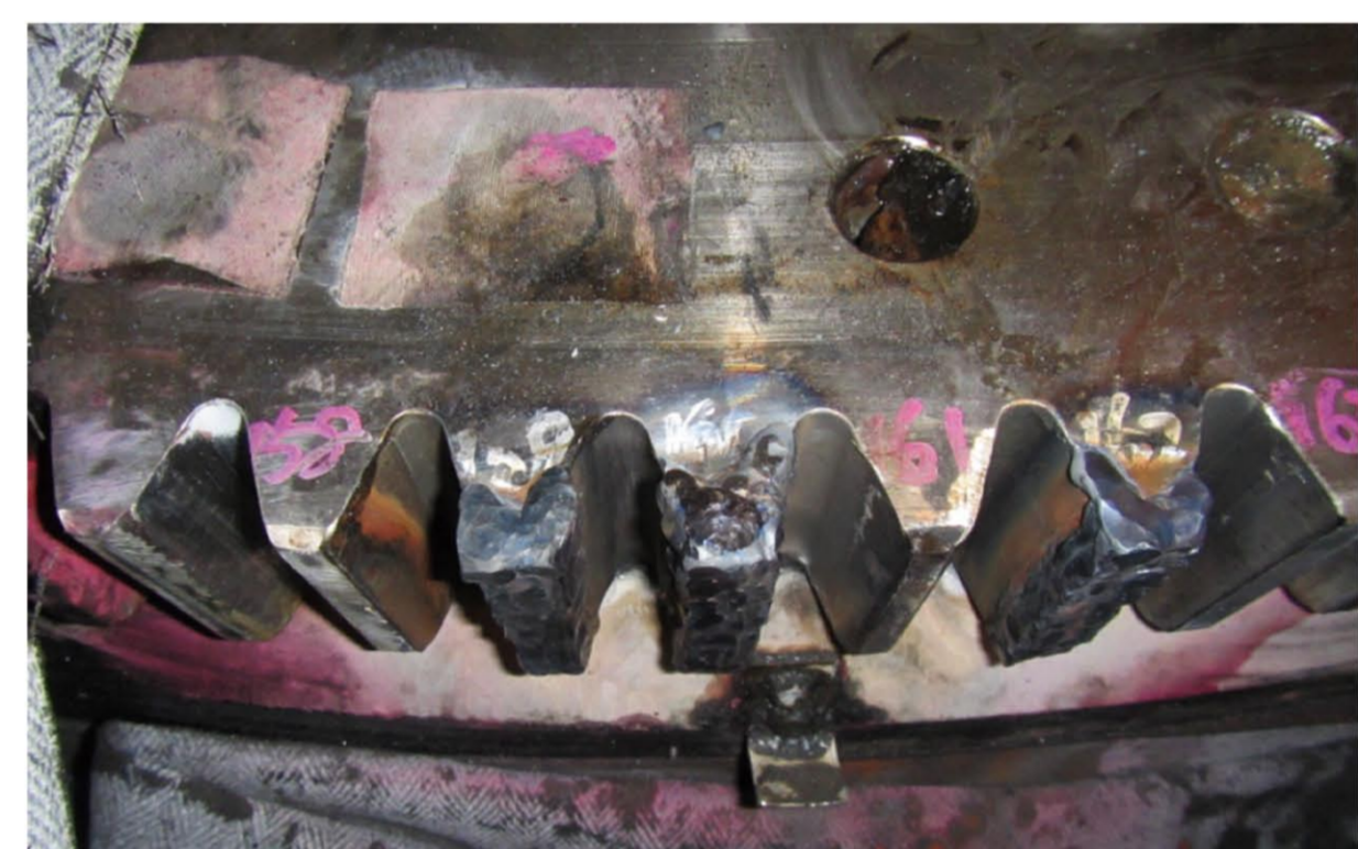
肉盛溶接(温度管理)