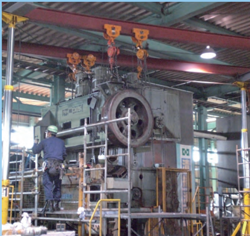
クランク式成型プレスの 完全分解整備