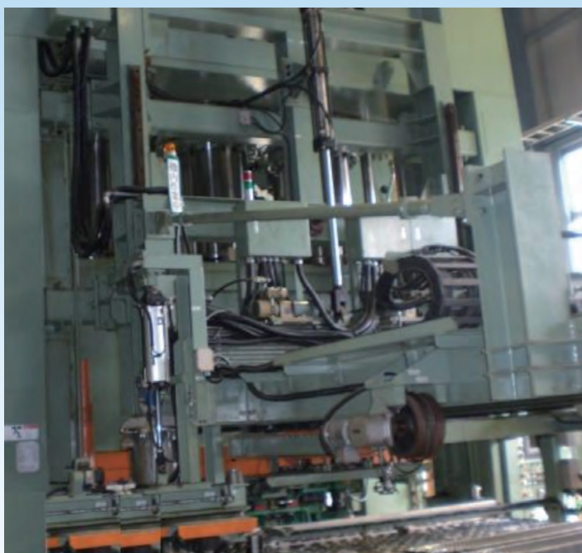
3000t油圧プレスの整備 (油圧装置改造含む)